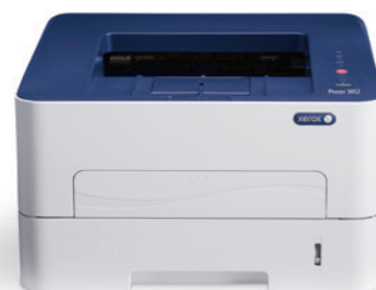
Phaser 3052: tiskárna.