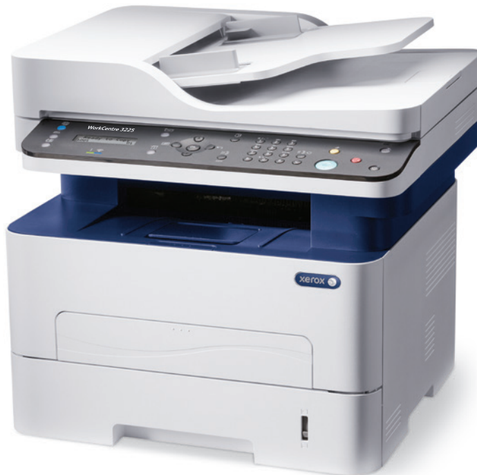
WorkCentre 3225: kopírování, tisk, skenování, faxování, e-mailu.